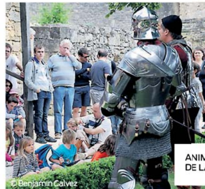
ANIMATIONS AU CŒUR DE LA FORTERESSE.

SITUÉ À UNE DIZAINE DE KILOMÈTRES DE SARLAT, EN PLEIN PÉRIGORD NOIR, LE CHÂTEAU DE CASTELNAUD FÊTE, CETTE ANNÉE, LES 30 ANS DE SON « MUSÉE DE LA GUERRE AU MOYEN ÂGE ». L'OCCASION DE (RE) DÉCOUVRIR UN SITE EXCEPTIONNEL.