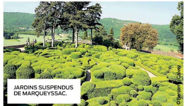
JARDINS SUSPENDUS DE MARQUEYSSAC.