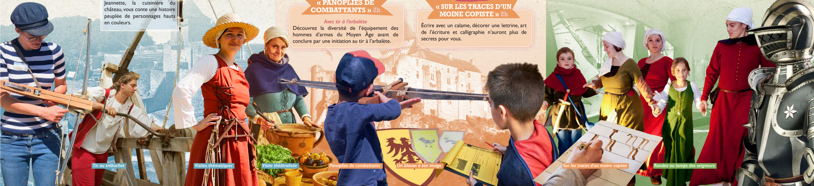
Tir au trébuchet

Menées par un guide costumé Tous en cercle pour quelques pas de danse au son des instruments du Moyen Âge.