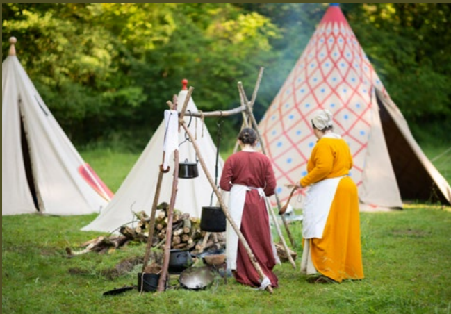
Baptiste Vignasse ©