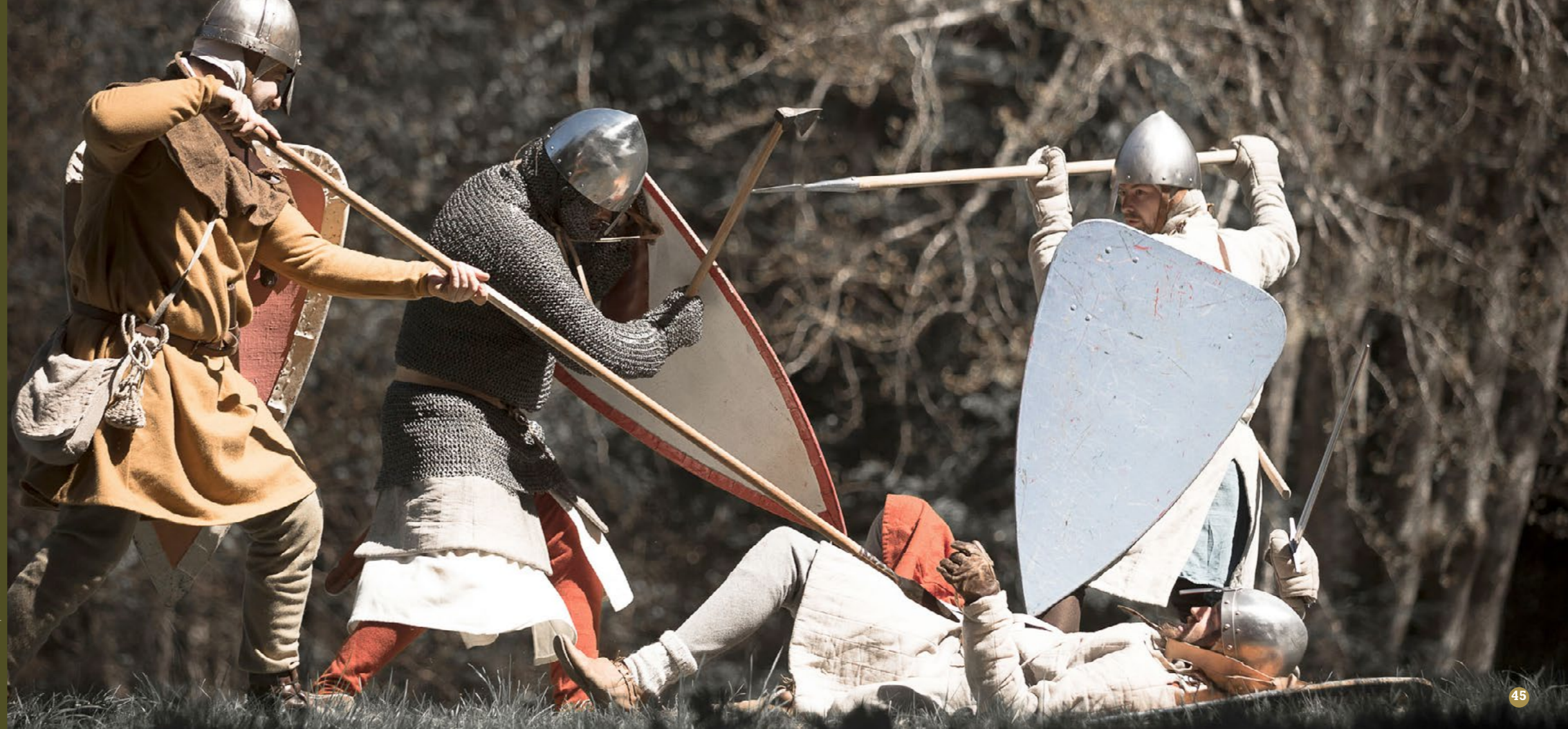
Sophie Narsés ©