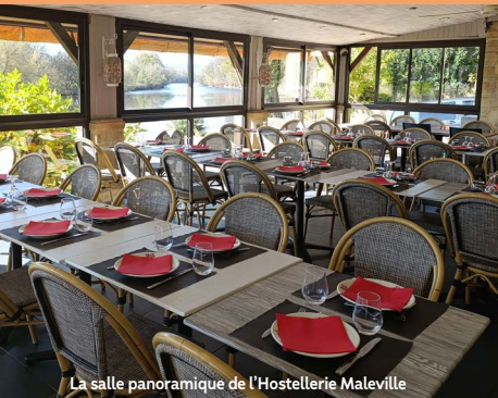
La salle panoramique de l'Hostellerie Maleville